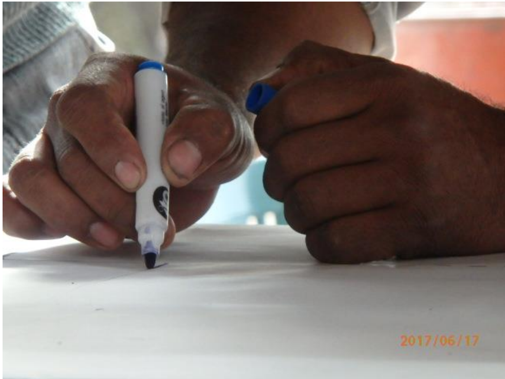
Imagen 5 – Dibujo en afiches del mapa